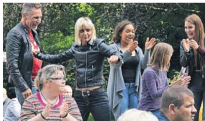
Viele Besucher ließen sich den Spaß während des Parkfestes der SPD nicht nehmen, auch wenn es zwischendurch heftig regnete.

„Wir wollen den Leuten etwas anbieten und mit ihnen ins Gespräch kommen“, nennt der Ortsvereinsvorsitzende das Ziel des Festes. Deshalb seien zum Beispiel auch alle Abgeordneten aus Bund und Land dabei. Das Parkfest gibt es bereits seit den 1980er Jahren und ist mittlerweile aus dem Veranstaltungskalender in Rheinhausen nicht mehr wegzudenken. Wie in den Jahren