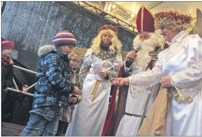
Der Nikolaus wird wie jedes Jahr die kleinen Besucher des Weihnachtsmarktes mit Geschenken überraschen.

Es folgen zwei Tage voller Kurzweil! Nach der Eröffnung des Weihnachtsmarktes am Samstag, 8. Dezember, 15 Uhr, präsentiert die Musikschule Rosenberger-Pügner um 15.15 Uhr, in der Kirche „Cup Cakes“. Um 16 Uhr kommt der Nikolaus höchstpersönlich. Er hat, gestiftet vom Runden Tisch, für jedes Kind einen Weckmann mitgebracht, meisterlich gebacken von der Bäckerei Wiedemann. Es folgt im Anschluss, also gegen 17 Uhr, die beliebte „Kommentierte Bilder-Show“ – Ferdi Seidelt zeigt via Power-Beamer