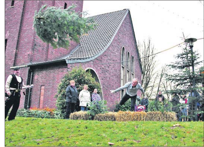
Beim „Tannenbaumweitwurf“ gilt es Spaß zu haben und Rekorde vom Vorjahr zu brechen.

Auf ein geselliges Wochenende freuen sich die evangelische Kirchengemeinde Rumeln-Kaldenhausen und der Runden Tisch Rumeln-Kaldenhausen.